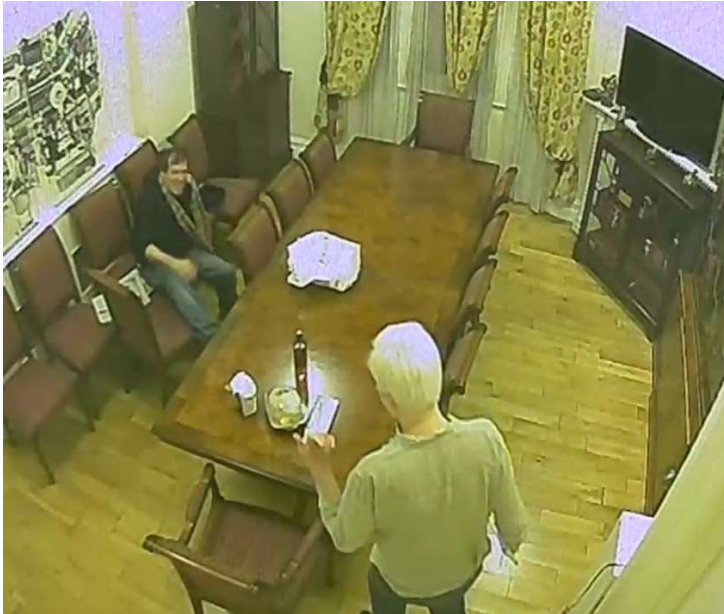
Imágenes de UC Global del comediante y activista Randy Credico visitando a Julian Assange en noviembre de 2017